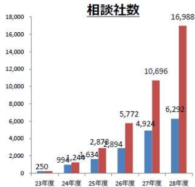
中小企業庁の事業引継ぎセンター